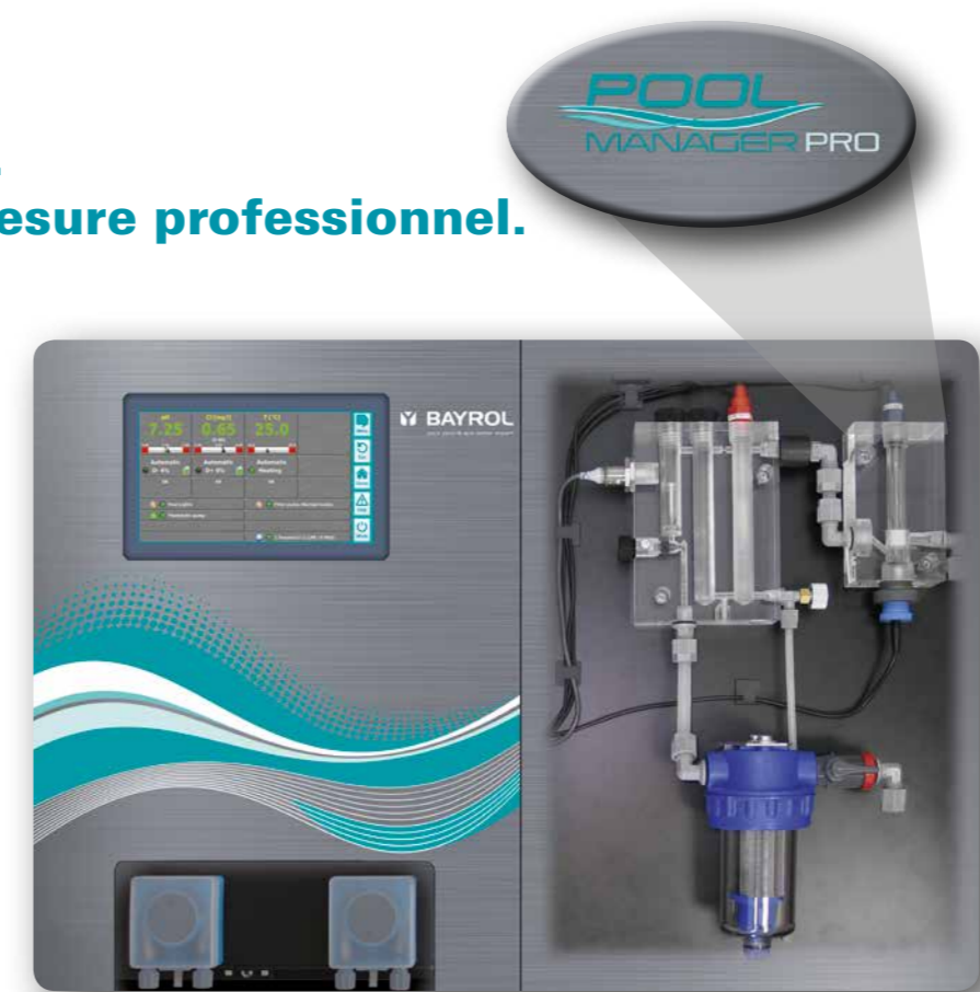
Vue en coupe

Vous souhaitez traiter l'eau de votre piscine de la même manière que dans les piscines publiques ? Rien de plus simple avec le PoolManager® PRO. Il mesure la concentration de chlore en mg/L pour une qualité parfaite de l'eau de piscine. Ça, c'est vraiment PROfessionnel.